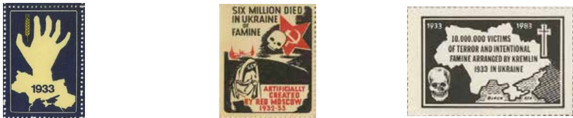
Рис. 2. Поштові емісії різних держав, присвячені пам'яті голодомору 1932–1933 рр.

Тиражі марок в середньому по 0,85 – 1,0 млн. примірників [17, с. 12–13].