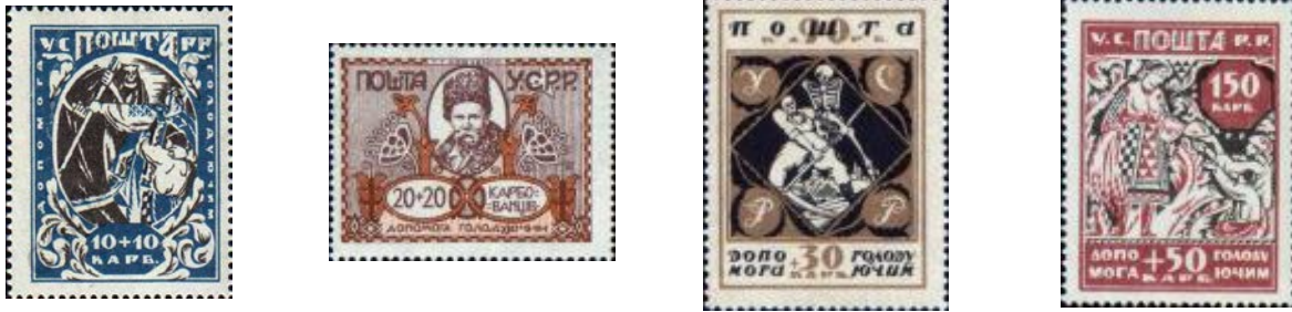
Рис. 1. Поштові марки УСРР (1923 р.)